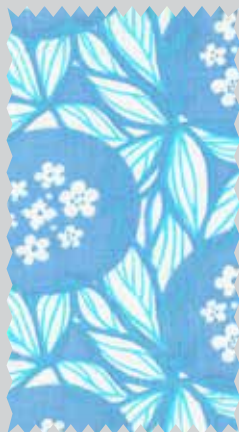
Maasike Maasik. 1969 Маасике Маасик. 1969