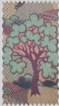
Veniamin Tšutšin. 1980 Вениамин Чучин. 1980