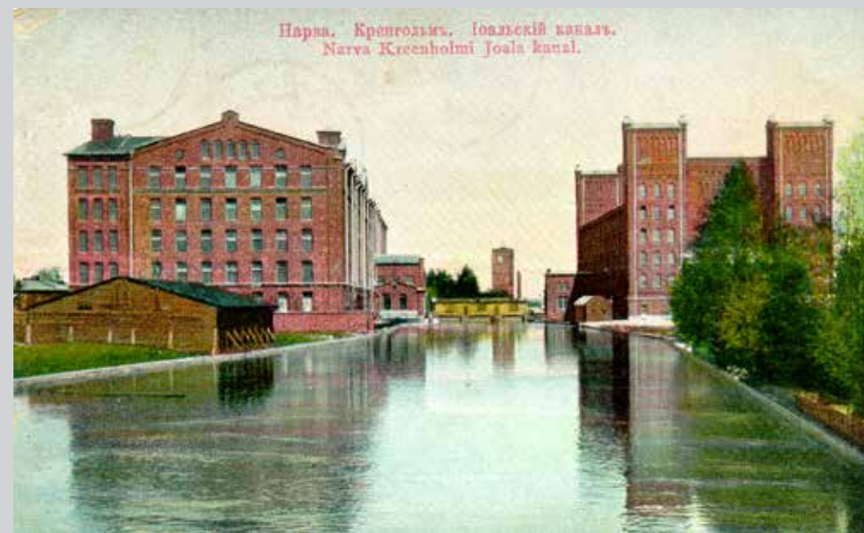
Narva Kreenholmi Joala kanal. 1905–1907.