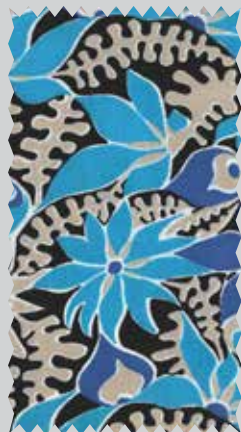
Lehte-Le Kõiva. 1969 Лехте-Ле Кыива. 1969