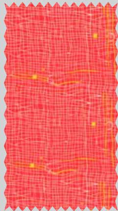
Boriss Uvarov. 1986 Борис Уваров. 1986