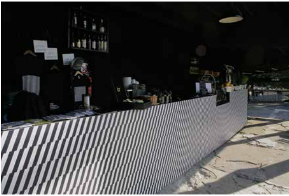
Teater N099 Põhuteatri vaade, 2011.